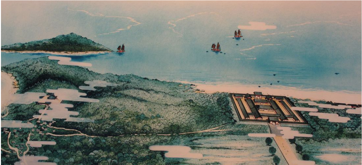
約 1200 年前（平安時代）、鴻臚館を中心に国際交流が行われていたようすのイメージ図